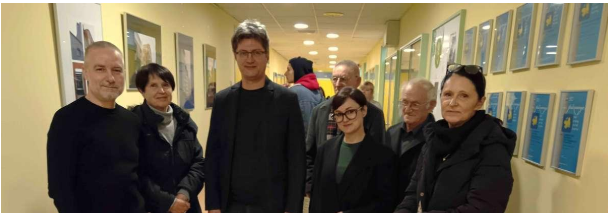
Slika 6: Razstava