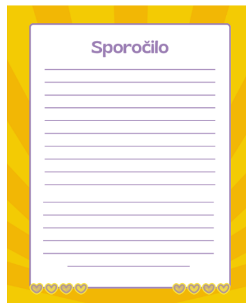
Slika 2: PRIPRAVA PREDLOGE ZA PISANJE SPOROČIL