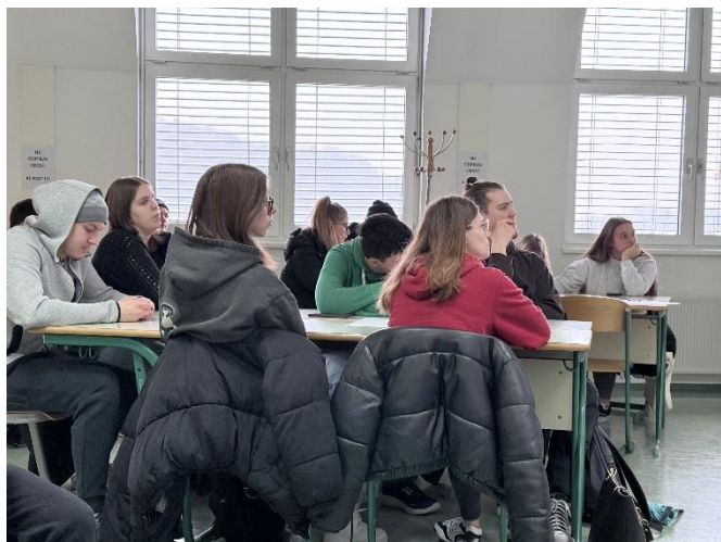
Slika 4: ŠTUDENTI MED PREDAVANJEM