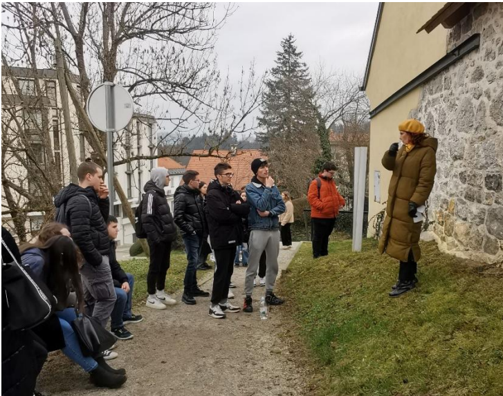
Slika 5: Ob mestnem obzidju na Šancah