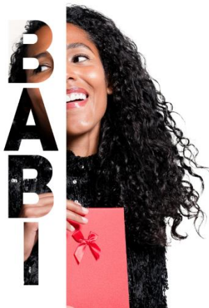
Slika 1: OBLIKOVANJE VOŠČILNICE

V drugem delu delavnice so dijaki praktično uporabili pridobljeno znanje. Ustvarjali so predloge za pisanje sporočil in oblikovali voščilnice za stanovalce Doma starejših občanov Novo mesto, ki jim jih bodo izročili ob 8. marcu, Dnevu žena. Dijaki so se imeli priložnost kreativno izražati in razvijati digitalne spretnosti na zabaven in uporaben način.