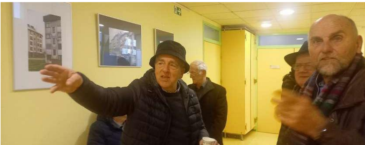
Slika 7: Razstava