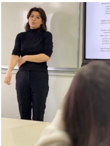
Slika 3: PREDAVATELJICA

Delavnica je trajala 8 ur in je vključevala različne module, ki so zajemali osnovne pojme prekarnosti, pravne vidike prekarne dela, spoznavanje prekarne oblike dela na primerih, pripravo pogodbe vezane na delovno razmerje, finančno in digitalno pismenost ter zdravje na delovnem mestu. Udeleženci so spoznavali različne oblike delovnih razmerij, delavske pravice, upravljanje financ, digitalna orodja in pasti prekarne dela. Poudarek je bil tudi na metodah sproščanja in spletnih portalih za pomoč pri težavah, povezanih s stresom, depresijo in izgorelostjo.