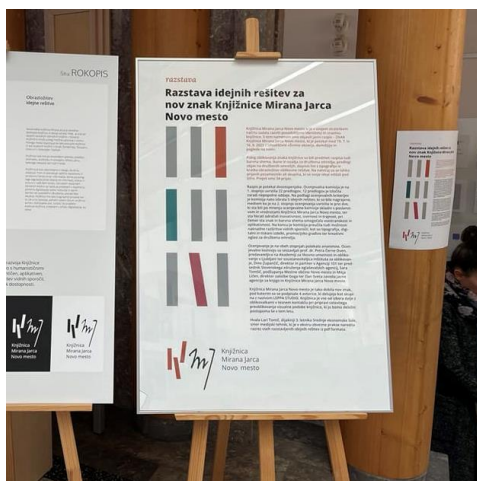
Slika 1: Plakat 1