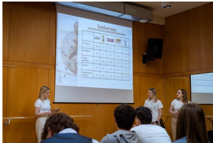
Slika 4: Ekipa La Keks pri predstavitvi poslovne ideje

Udeleženci in mentorji so po tekmovalnem delu prisluhnili okrogli mizi z naslovom Od tekmovanja POPRI do uspešnega podjetja (Kako naj (mlad) podjetnik zaščiti svoje znanje, inovativne rešitve in ime). Sledila je izkušnja podjetniškega mreženja, v večernih urah pa gala prireditev v SNG Nova Gorica, kjer so podelili nagrade zmagovalcem.