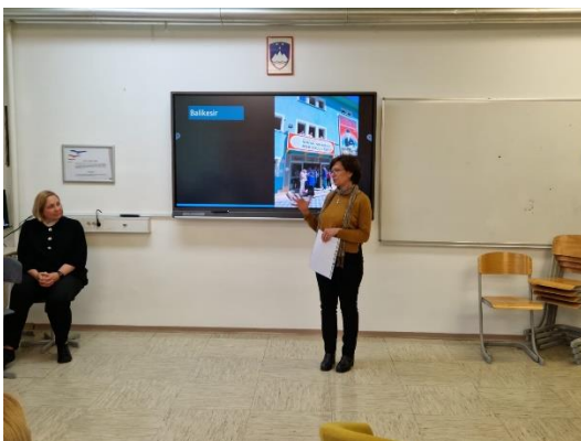
Slika 12: Predstavitev vtisov iz Turčije