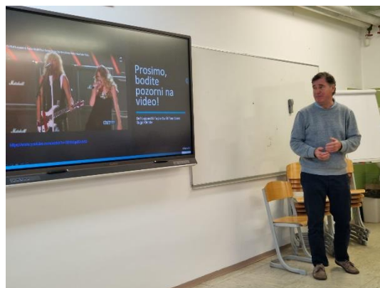
Slika 11: Predstavitev inkluzije na Portugalskem