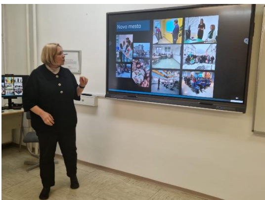
Slika 10: Predstavitev projekta in rezultatov