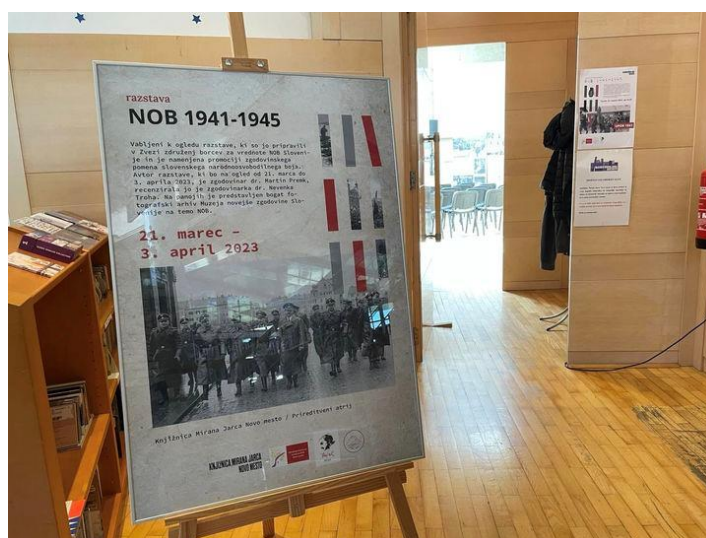
Slika 3: Plakat 3