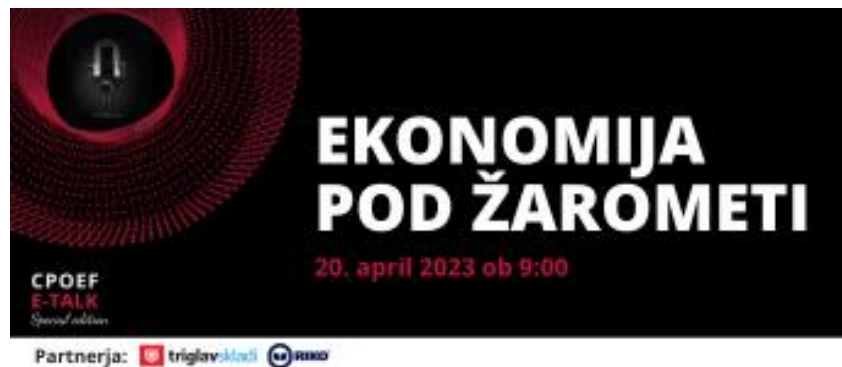
Slika 9: Baner za dogodek