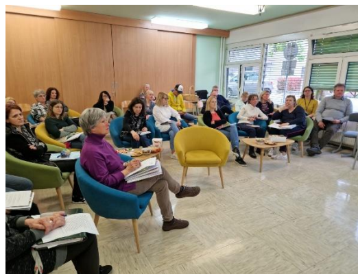
Slika 13: Učiteljski zbor srednje šole