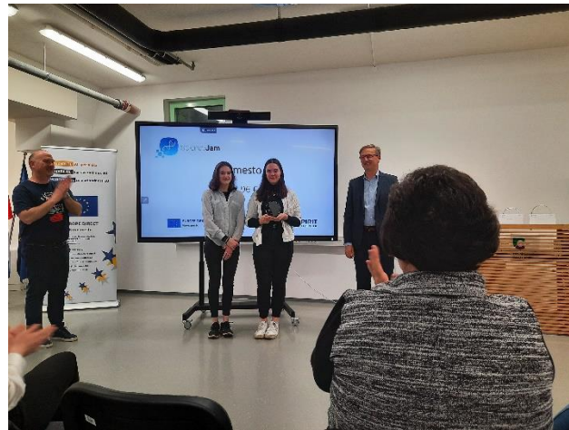
Slika 6: Podelitev nagrad

Tekmovalne ekipe so nastopile s poslovnim pitchem, v katerem so 4-članski ocenjevalni komisiji predstavile poslovne modele, po katerih bi svojo rešitev s področja znanosti lahko plasirale na trg.