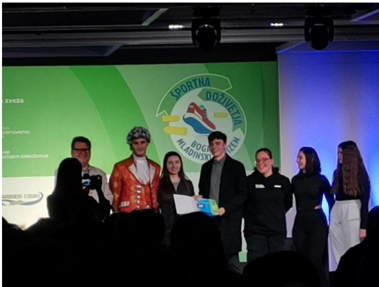
Slika 3: Ekipa Pobeg v preteklost

Študenti 2. letnika Medijske produkcije so v okviru predmeta Organizacija in vodenje medijske produkcije pripravili dve nalogi za natečaj Turistične zveze Slovenije z naslovom Športna doživetja bogatijo mladinski turizem, s katerima so se 15. februarja predstavili na sejmu Alpe-Adria na Gospodarskem razstavišču v Ljubljani. Obe nalogi, tako Pobeg v preteklost kot Kuolm mj'ldada, sta osvojili srebrno priznanje. Prav tako sta si obe nalogi, ki sta bili med srebrnimi priznanji med najvišje ocenjenimi, prislužili praktično nagrado in sicer veslanje po Zbiljskem jezeru.