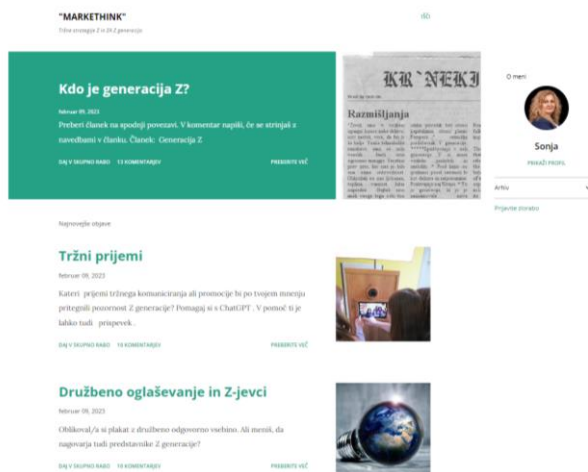
Slika 7: Izsek iz bloga

Predavateljica Sonja Kukman je 16. februarja za dijake 3. B izvedla delavnico z naslovom »MARKETHINK« - Promocija po meri z-generacije. Delavnico je izvedla kot delo z blogom, preko katerega so dijaki spoznali pojme družbeno odgovorno oglaševanje, z-generacija in ChatGPT.