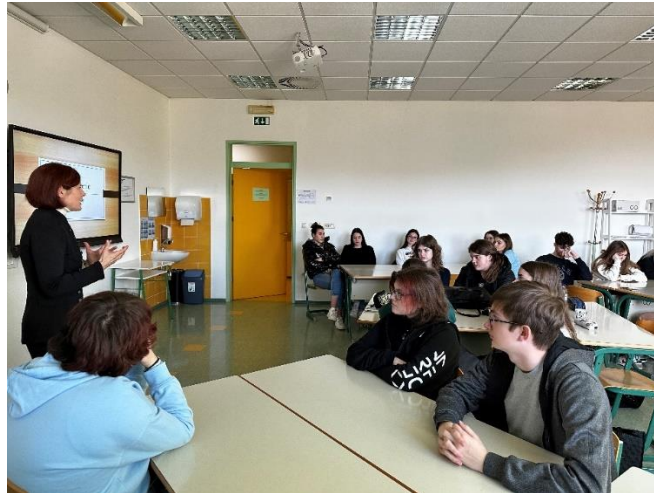
Slika 8: Dijaki med predavanjem

so kasneje v mešanih skupinah s pomočjo viharjenja možganov ustvarili zgodbo za produkt, s katerimi so se študenti predstavljali na podjetniškem tekmovanju.