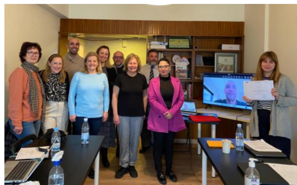
Slika 2: Uspешen zaključek dvodnevnega srečanja