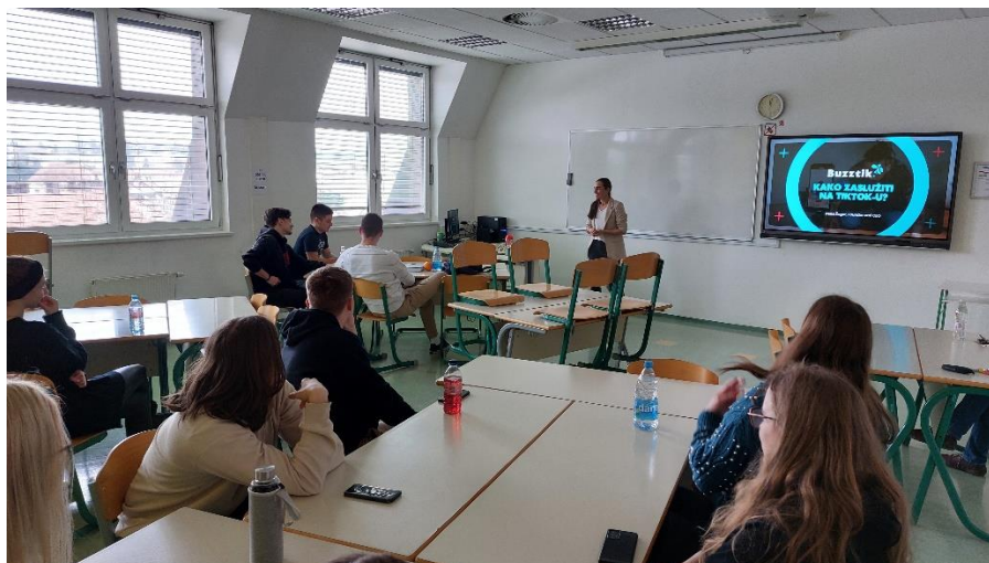
Slika 9: Predavanje v teku

Žagarjeva je razložila, kako deluje TikTokov algoritem in kako ga je mogoče izkoristiti za doseganje večjega števila ogledov in sledilcev. Poudarila je pomen ustvarjanja originalnih in zanimivih vsebin ter kako lahko ustvarjalci vsebin uporabijo svoj slog in osebnost, da bi izstopali v množici.