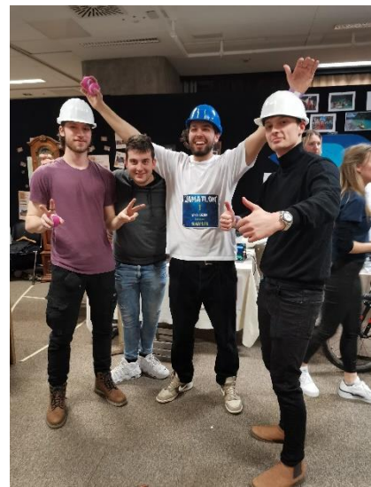
Slika 4: Ekipa Kuolm mj'ldada