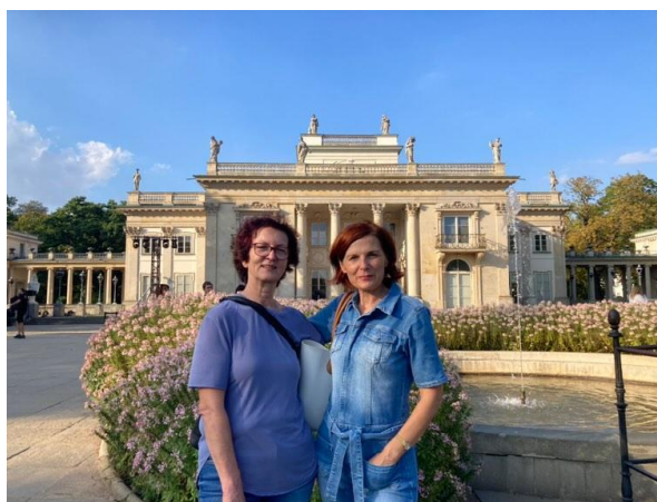
Slika 2: Nekaj časa smo namenili tudi ogledom varšavskih znamenitosti