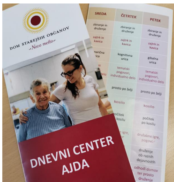
Slika 6: Oblikovali in natisnili smo že zloženko za Dnevni center Ajda

V prihajajočem študijskem letu bomo sodelovali s kar dvema pomembnima zunanjima naročnikoma v obsežnih projektih prenove njihove Celostne grafične podobe (CGP). Gre za nevladno organizacijo Društvo Šola zdravja, ki v 260-ih skupinah v 95-ih slovenskih občinah skrbi za jutranjo vadbo na prostem v vseh letnih časih, ter za Dom starejših občanov Novo mesto. Glede na prepoznavnost omenjenih organizacij, s katerima so povezane številne družine in posamezniki na Dolenjskem in v celotni Sloveniji, sta zaupani nalogi za nas pomembni, izdelki pa bodo za šolo odlična promocija.