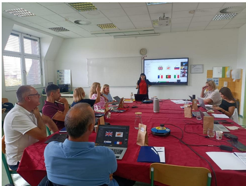
Slika 3: Projektno srečanje – testiranje inkubatorja

Cilj projekta je raziskati inovativne možnosti uporabe dronov ne le v novinarstvu, ampak tudi v mnogih drugih panogah. Na srečanju so partnerji testirali zadnji rezultat – inkubator z različnimi moduli za uporabo dronov. Razpravljali so tudi o diseminaciji projekta in finančnih podrobnostih.