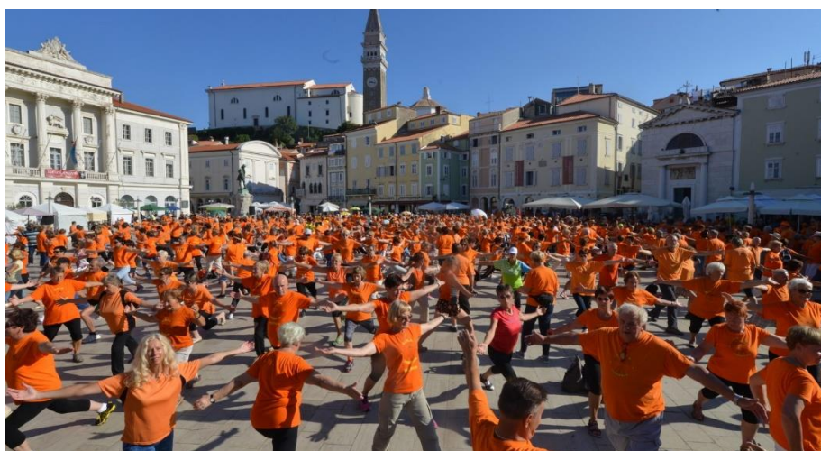
Slika 7: Društvo Šola zdravja nam je zaupalo prenovo njihove celostne grafične podobe