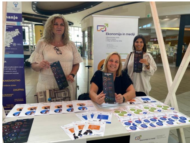
Slika 5: Predstavitev na stojnici v nakupovalnem centru