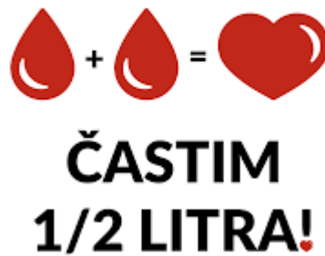
Slika 3: Slogan študentske krvodajalske akcije

Družbeno odgovorno ravnanje je eden od ciljev, ki si jih je študentska skupnost zastavila v letnem delovnem načrtu, zato bomo v bodoče spodbujali študente k še bolj množični udeležbi na krvodajalskih akcijah.