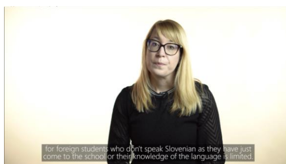
Slika 2: Film 2